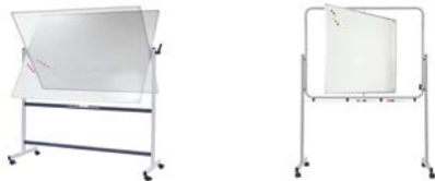
TABLEAU PIVOTANT SUR AXE HORIZONTAL